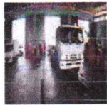
Foto Belakang Image Rear